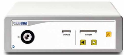
12-300X / 12-380X / 12-500X

Same as 12-500X but with video input terminal (BNC) for automatic light intensity control, turret connection