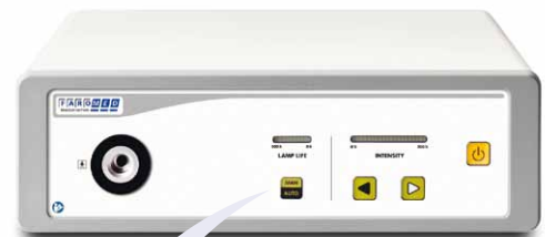
12-300X-A / 12-380X-A / 12-500X-A