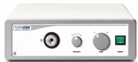
12-0150D / 12-0250