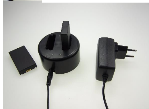
Option:10-10815 charger for 2 batteries