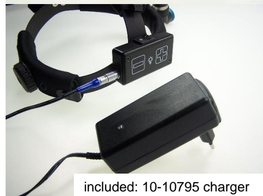
included: 10-10795 charger