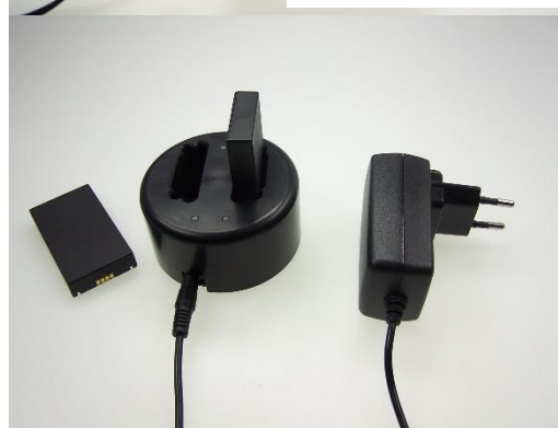
Optional Ladegerät für 2 Akkus