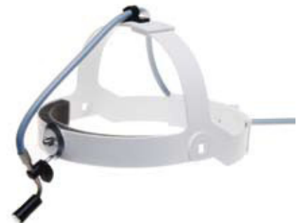
8-445 / 08-455