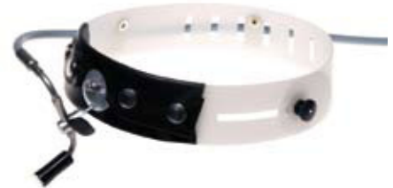
08-315 / 08-325

Fibre optic miniature headlight for operation theatre. The continuous fibre bundle of 2.6 mm diameter and the small optic effect a small and bright light spot. Size and direction of the spot can be adjusted. The ergonomic headband with cross band can be adjusted by one hand and provides comfortable wearing for long period of use. Without adapter for light source.