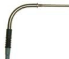
08-362 / 08-367 / 08-372 / 08-377